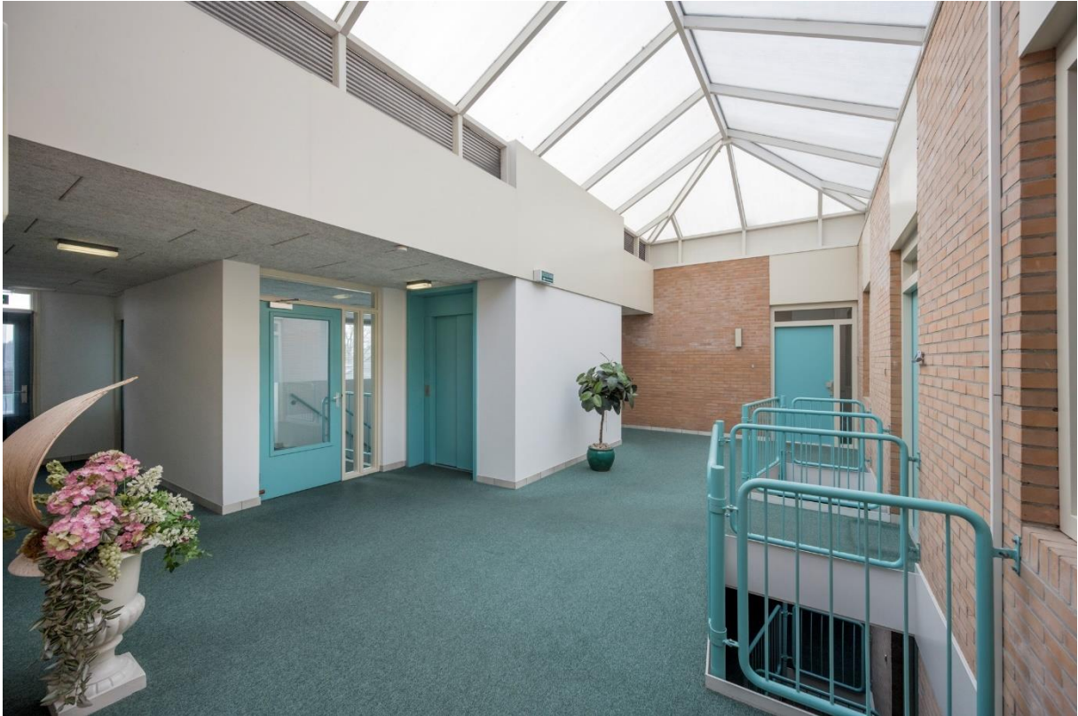
Centrale hal 3 e woonlaag met toegang tot gezamenlijk balkon